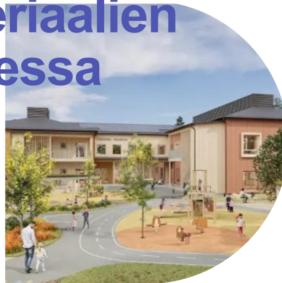
Havainnekuva: Arco Architecture Company

→ määrittää joukon luontaisesti vähäpäästöisiä materiaaleja, jotka voidaan tiloja suunniteltaessa rinnastaa M1-luokiteltuihin tuotteisiin.